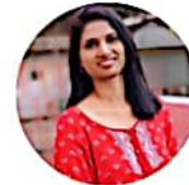
Speaker: Nija Outreach Coordinator at Vegan Outreach, India